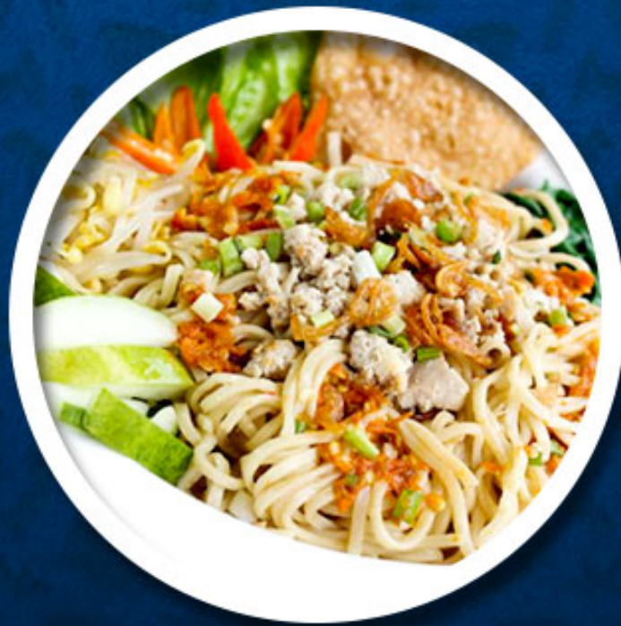
Cwie Mie Malang